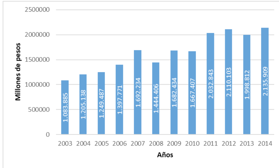
Gráfica 8.1 Evolución de los Ingresos del Departamento, 2003-2014.