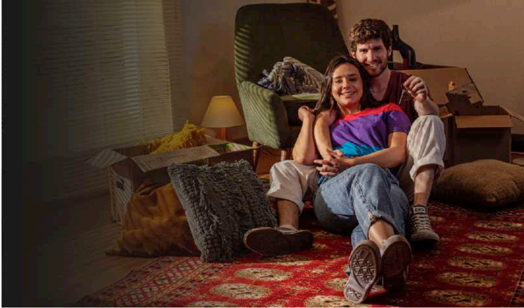
Generación FNA cumple sueños en vivienda para los jóvenes colombianos

Generación FNA es una línea de crédito especializada para jóvenes colombianos entre 18 y 28 años, la cual cuenta con beneficios especiales para que puedan hacer realidad su sueño de tener vivienda propia.