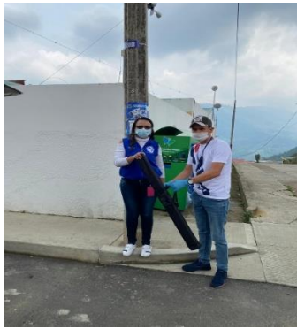
San Juan de Rio Seco