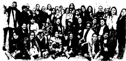
Ilustración 6 Primer Encuentro Departamental de Consejos Consultivos de Mujeres Diciembre 04 de 2017