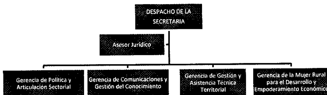
Ilustración 1 Estructura Administrativa