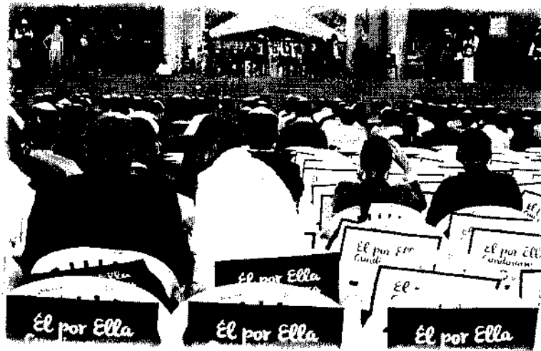
Ilustración 7 Evento Público adhesión a la estrategia "El por Ella"

Se realizó el diseño e implementación de la estrategia integral la cual busca promover en los 30 municipios priorizados para el 2017, el desarrollo de la jornada sociocultural "PINTA TU CARA" como expresión de reconocimiento y promoción de los derechos humanos integrales e interdependientes de las mujeres; además, buscando garantizar, en las mismas poblaciones, la prevención de violencias basadas en género, a través de la estrategia: "Hoy te vas a querer como nunca,"; y la vinculación de hombres cundinamarqueses, defensores de la igualdad y equidad de género, en la campaña "EL POR ELLA", iniciando con la vinculación de los funcionarios de la Gobernación de Cundinamarca.