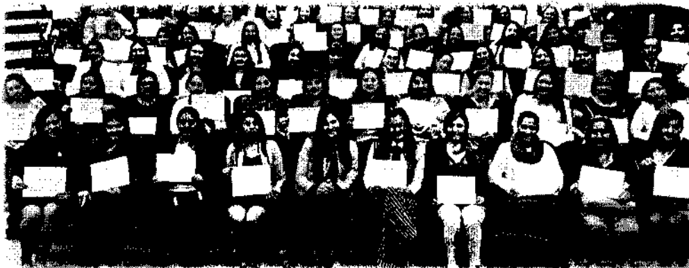
Ilustración 3 Clausura Escuela de formación política: Liderazgo, paz y género