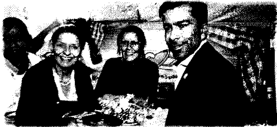
Ilustración 2 Apoyo a Proyectos de Mujeres – ExpoCundinamarca - 2017