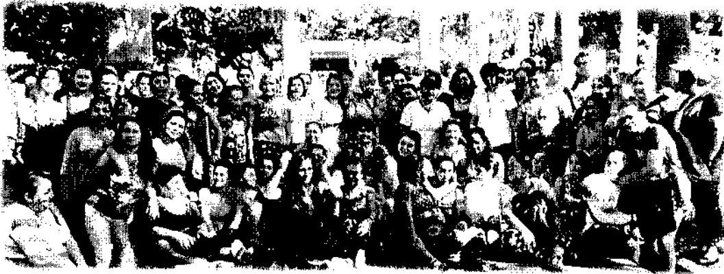
Ilustración 5 Implementación Escuela de formación política: Liderazgo, paz y género Provincia de Gualivá

En el marco de los derechos políticos se desarrolló la escuela de formación política, liderazgo, paz y género dirigida a mujeres (víctimas del conflicto, rurales, jóvenes y pertenecientes a consejos consultivos u otros procesos organizativos) de 5 provincias del Departamento (Sabana Centro, Sabana Occidente, Tequendama, Gualivá y Soacha). La cual contó además con formación en torno al derecho a una vida libre de violencias desde el ejercicio de la participación, el proceso fue finalizado por 273 mujeres de 39 municipios