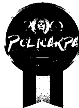
TABLA DE ILUSTRACIONES